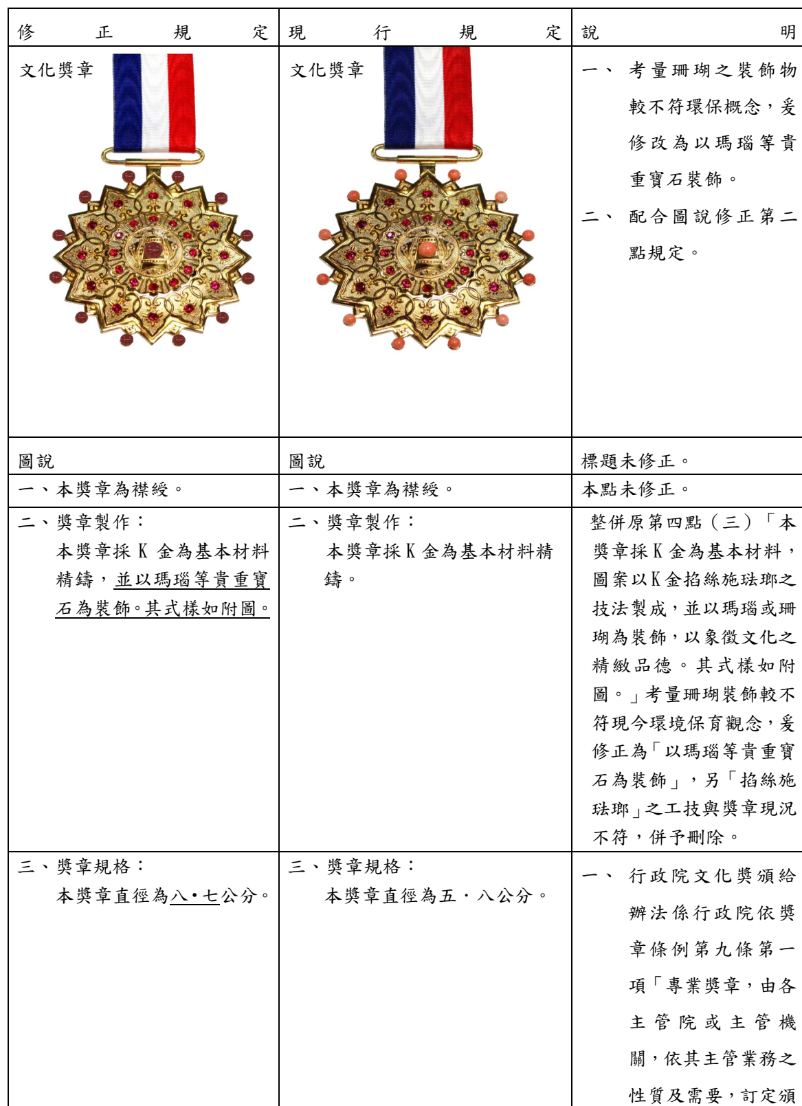
行政院文化獎頒給辦法第二條附表一修正草案對照表